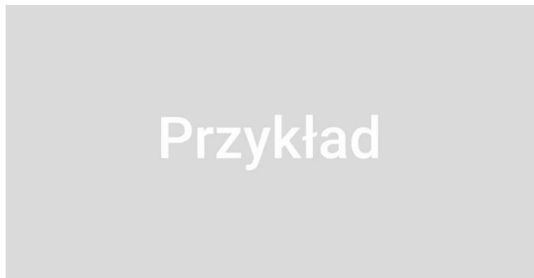
Rys. 4.1 Opis rysunku

Lorem ipsum dolor sit amet, consectetur adipiscing elit, sed do eiusmod tempor incididunt ut labore et dolore magna aliqua. Ut enim ad minim veniam, quis nostrud exercitation ullamco laboris nisi ut aliquip ex ea commodo consequat. Duis aute irure dolor in reprehenderit in voluptate velit esse cillum dolore eu fugiat nulla pariatur. Excepteur sint occaecat cupidatat non proident, sunt in culpa qui officia deserunt mollit anim id est laborum.